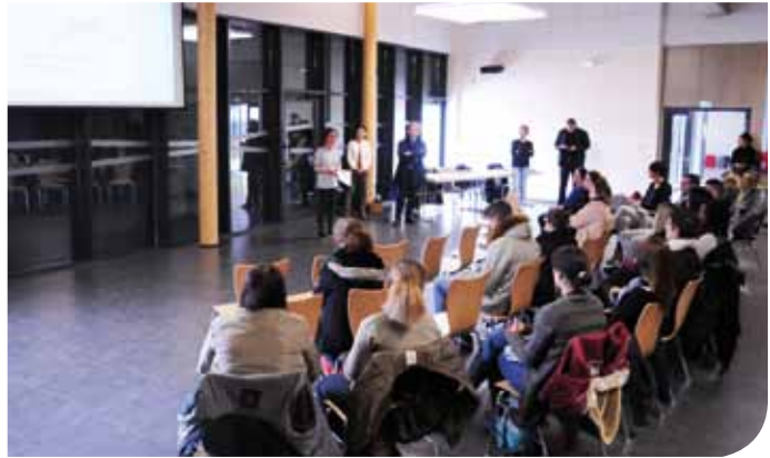
Le dispositif préparation aux entretiens d'embauche a été présenté en mars dernier aux Quetignois

Après la réactivation du service municipal « Agir pour l'emploi » et la mise en place d'un partenariat actif de recrutement avec Pôle emploi et les entreprises locales, deux nouveaux dispositifs d'accompagnement à un retour vers l'emploi portés par la Ville et ses partenaires voient le jour pour soutenir les projets professionnels des demandeurs d'emplois quetignois.