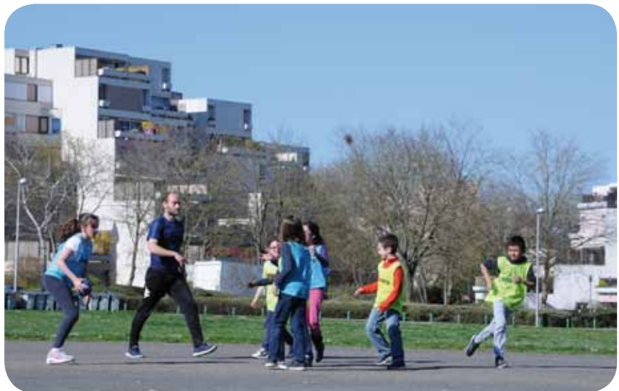
Des animateurs qualifiés encadrent les activités des enfants

Accompagner les jeunes dans leurs parcours citoyen, culturel, social... favorisant leur prise d'initiatives, leur responsabilisation et leur enrichissement personnel marque une volonté forte de la Ville et de ses partenaires et s'inscrit pleinement dans le Projet Educatif de Territoire de Quetigny.