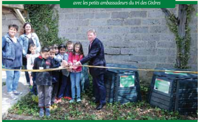
Inauguration symbolique de la plateforme de compostage avec les petits ambassadeurs du tri des Cèdres