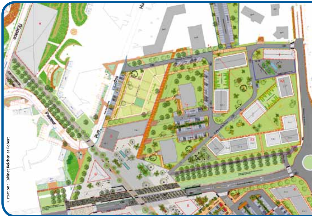
Plan de situation du futur quartier de l'îlot A à l'angle des avenues du Château et du Cromois.

A l'issue d'une démarche de réflexion, d'études et d'une très large concertation, une nouvelle page de l'histoire urbaine de Quetigny s'ouvre avec à terme de nouveaux services, logements, commerces et équipements au cœur de la ville. Pour rappel, ce projet s'appuie sur des principes innovants de développement durable et de bien habiter ensemble et vise à conforter le lien social, l'animation, les services et le commerce de proximité essentiels à l'attractivité du centre-ville.