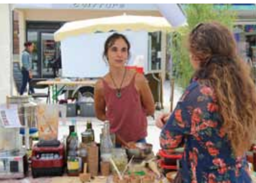
Marché bio Succès de la 3 e édition p.6