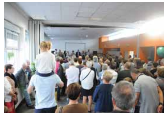
Équipement Ouverture de l'espace Francis-Moulun p.13