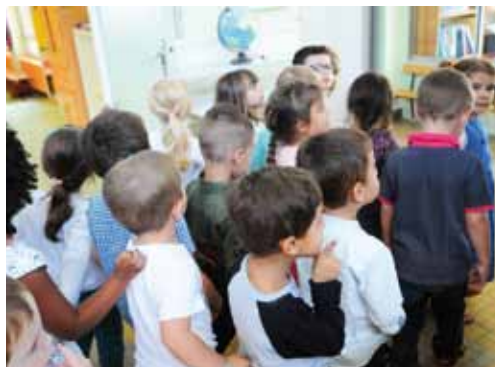
Actions éducatives Un nouveau PEDT validé p.7