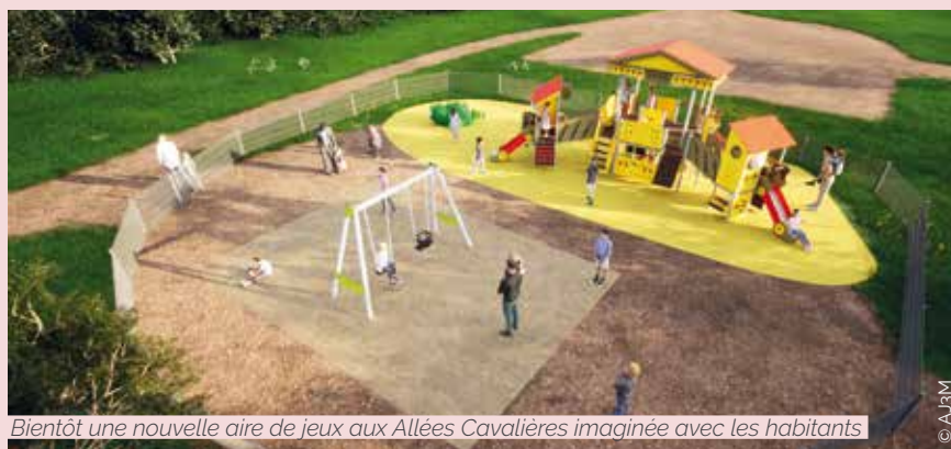
Bientôt une nouvelle aire de jeux aux Allées Cavalières imaginée avec les habitants

a fait l'objet d'une consultation fin 2024 avec les habitants (parents et enfants) et les assistantes maternelles du quartier. Après avoir validé le lieu, les participants ont planché sur le choix des jeux à partir de solutions "clés en main" proposées afin de définir leur aire de jeux idéale. Ont été validés une aire de jeu pour les 2-12 ans comprenant une grosse structure parcours avec tobogans, deux balançoires et un dinosaure, le tout protégé par une clôture pour un coût d'environ 100 000 € TTC. Prochain renouvellement d'ampleur accompagné d'un volet de concertation, le projet d'une aire de jeux au Grand Chaignet dans le cadre d'une importante rénovation de l'immeuble du 5 au 31 rue Ronde conduite en 2026 par CDC Habitat.